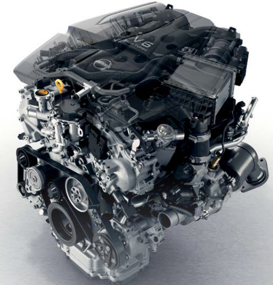
Motor V6 Twin-Turbo de 3.0 litros, 400hp y 350 Lb-pie de torque

Nissan Z cuenta con nuevos amortiguadores monotubo, una nueva geometría delantera, Frenos Akebono (R) de 4 pistones y puesta a punto de la suspensión trasera pensados para ofrecer una experiencia de manejo sobresaliente. La dirección asistida eléctrica permite mejor maniobrabilidad para un control y una precisión excepcionales.