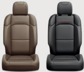
Asientos Rubicon color café montura obscuro