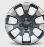
Rines de aluminio de 18" en Tech Gray con facetas maquinadas