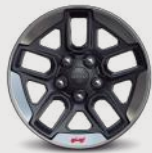
Rines de aluminio con contorno maquinado de 17"