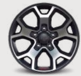
Rines de aluminio con acentos en negro de 17"