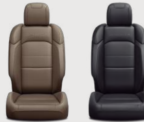
Asientos Sahara color café montura obscuro