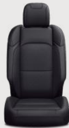
Asientos con tela negra