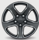
Rines de aluminio "Tech Silver" de 17"