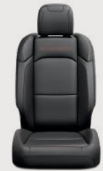
Asientos Rubicon con tela premium negra