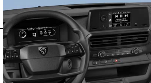
Pantalla táctil de 5" monocromática