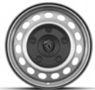
RINES DE ACERO DE 16"