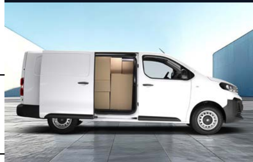
Carga 1,400 kg | 6.1 m 3