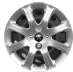
RINES DE ACERO DE 14"