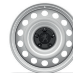
RINES DE ACERO DE 16"