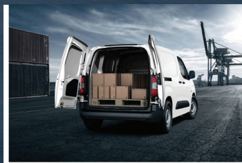
Capacidad de carga de hasta 1,000 KG