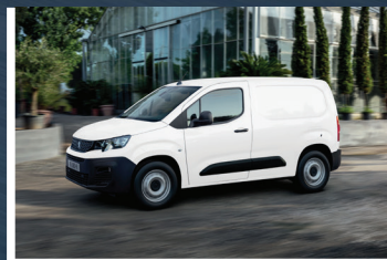
Rendimiento de hasta 21.7 KM/L