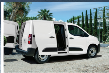
Capacidad volumétrica de hasta 3.9m 3