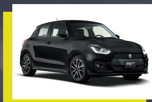
Negro Supremo. 1, 2