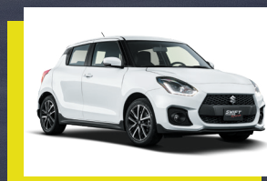
Blanco Pop. 1, 2