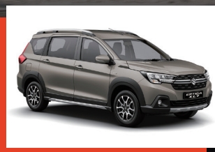
Gris Magma. 1, 2