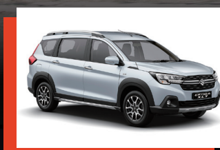
Blanco Perlado. 1, 2