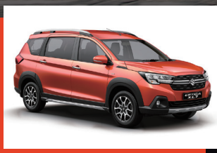
Naranja Atardecer. 1, 2