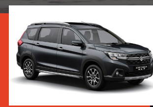
Negro Cosmos. 1, 2