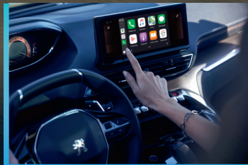
PEUGEOT i-cockpit® con pantalla de 10" HD