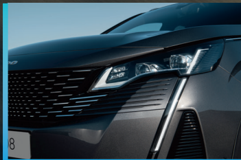
Nueva Firma Luminosa LED