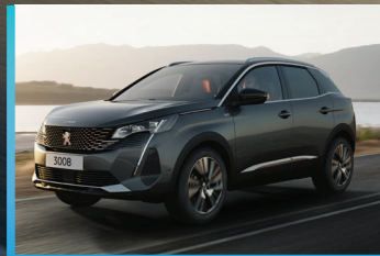
Motor Gasolina de alto rendimiento