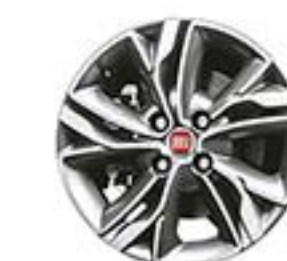
SPORTING Rines de aluminio de 15"