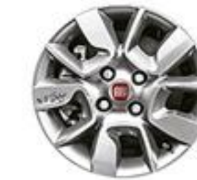
WAY Rines de aluminio de 14"