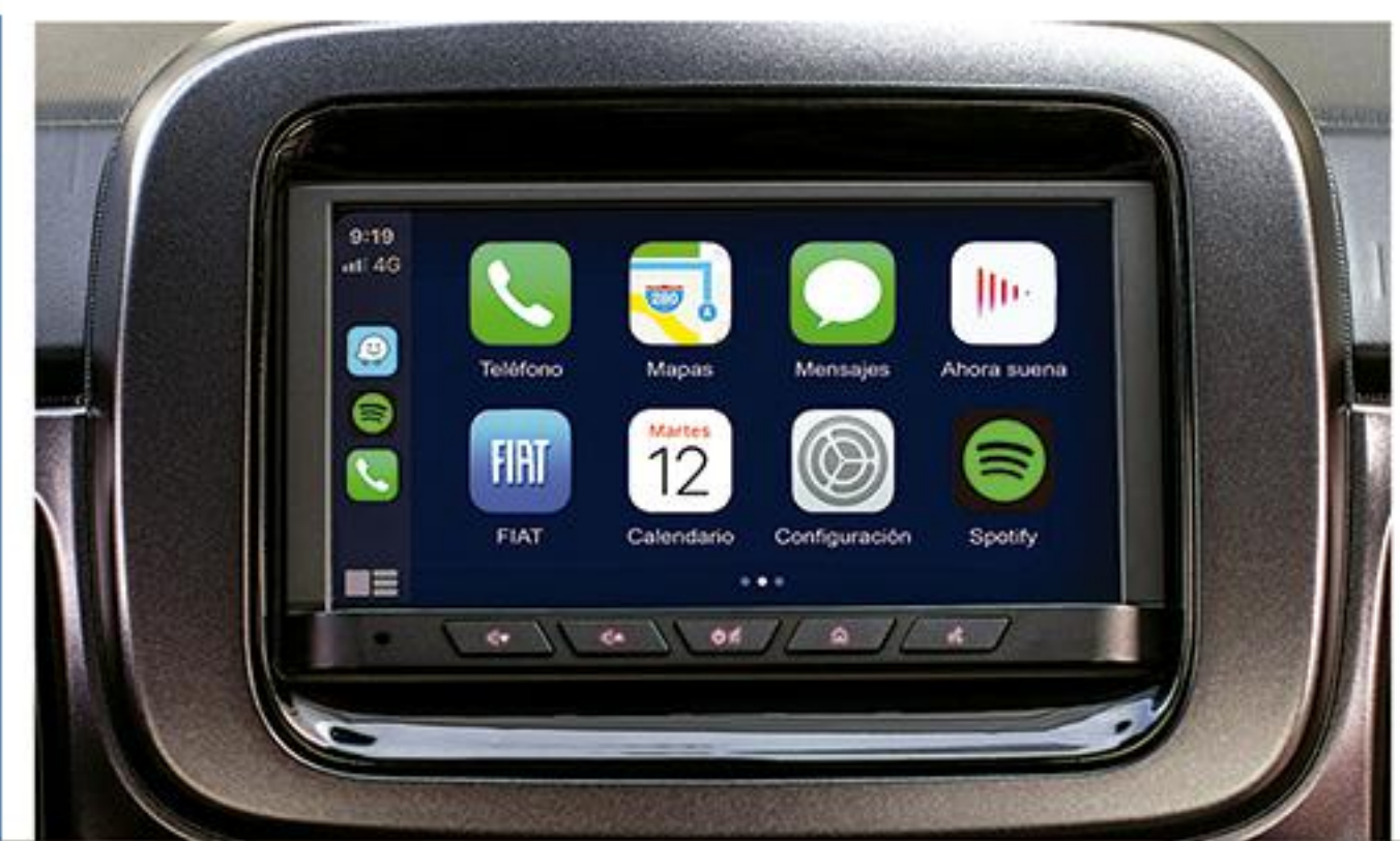
EQUIPADO CON PANTALLA TÁCTIL DE 7" *CONECTIVIDAD CARPLAY® Y ANDROID AUTO®