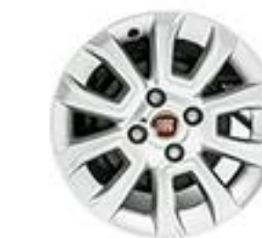
LIKE Rines de aluminio de 14"